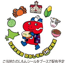
ご当地たのしみシールをブースで配布予定