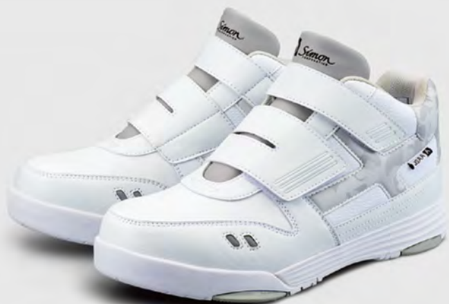
XG-22 ホワイト / 商品コード：2313330