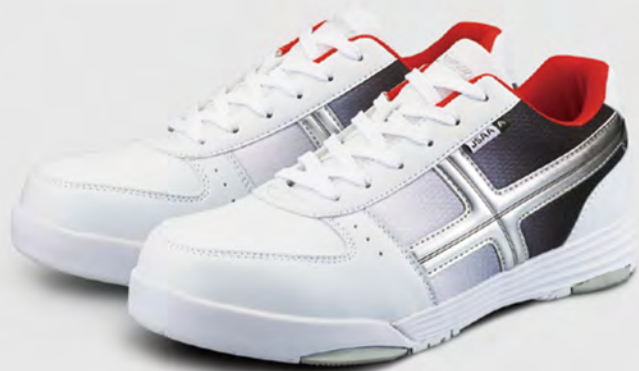
XG-11 ホワイト / 商品コード：2313320

規 格：JSAA 規格 A 種認定品 付加的性能：かかと部の衝撃エネルギー吸収性