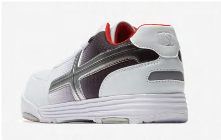
JSAA 規格「かかと部の衝撃エネルギー吸収性」