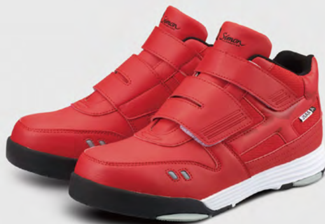
XG-22 レッド / 商品コード：2313340

規 格：JSAA 規格 A 種認定品 付加的性能：かかと部の衝撃エネルギー吸収性