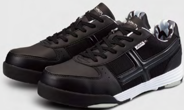
XG-11 ブラック / 商品コード：2313310