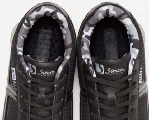
足にフィットする履き口のクッションング