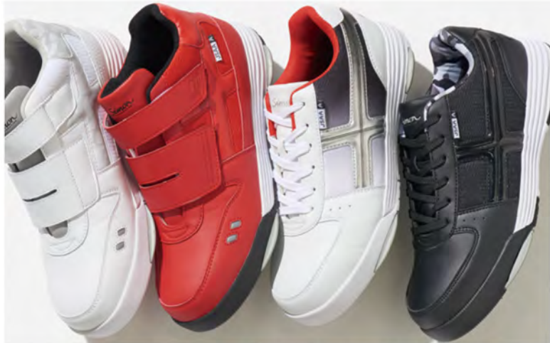
つま先部をしっかり守る鋼製先芯を内蔵