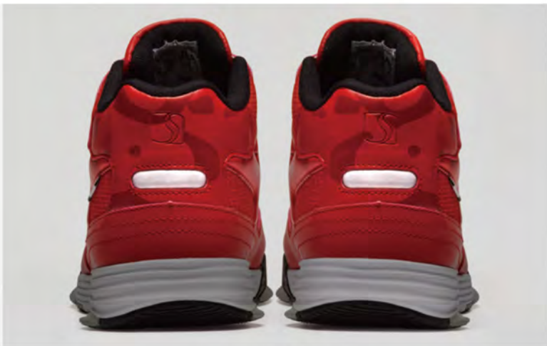
夜間でも安心な反射材